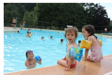
© Communauté de communes Haut Jura Saint-Claude

L'ouverture de l'équipement est programmée du 4 juillet au 29 août.